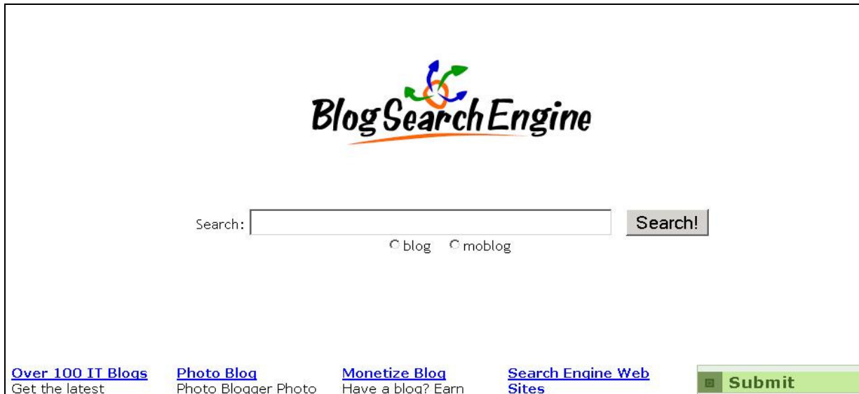
Tableau 2. Service de recherche de blogues

Un exemple de service de recherche de blogues, « BlogSearchEngine »